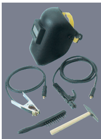
Masque à main, marteau, brosse et câble de série