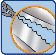
(108 dents) 59-62 HRC