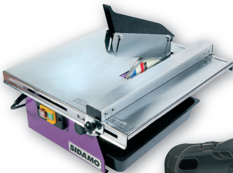
..... DIAMINIBOX 180