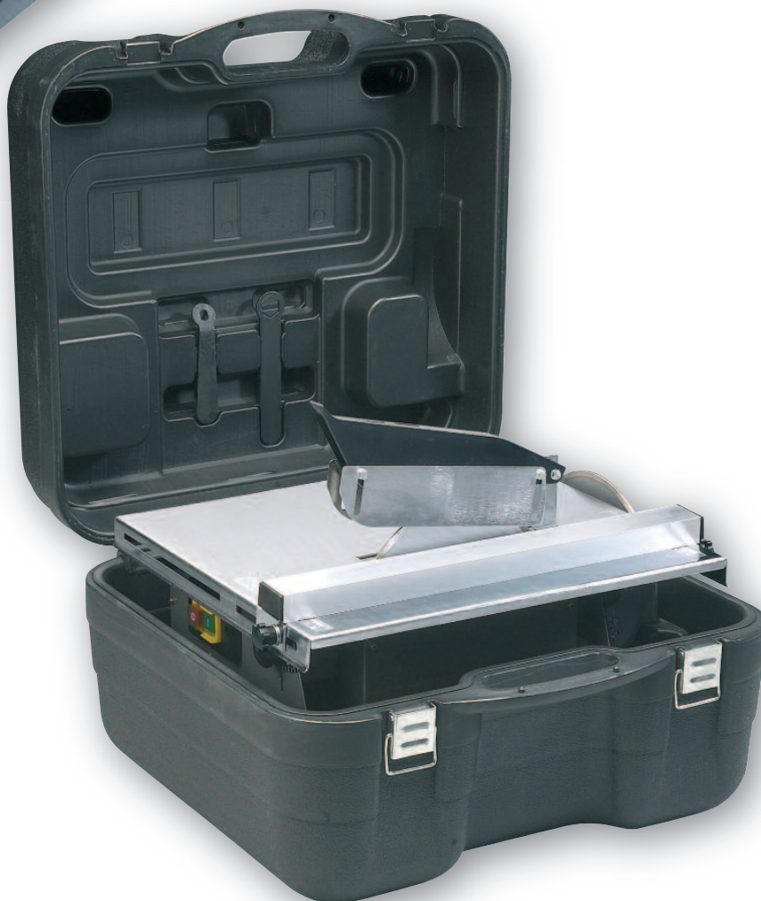
DIAMINIBOX 200 .....