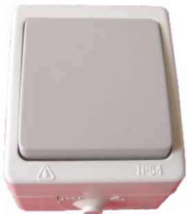
Va & vient