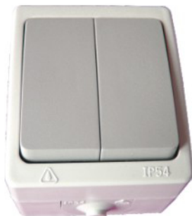
Double Va & vient

Prises conformes à la norme NF C 61-314 (2003)