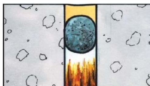
VEDAFEU + mastic