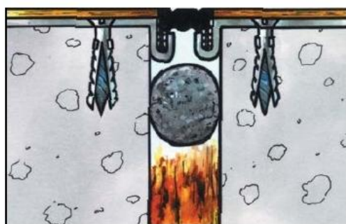
VEDAFEU + joint mécanique