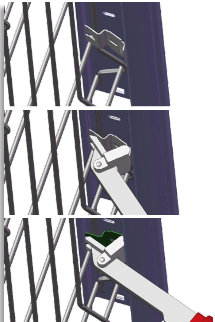
Montage du Clips avec le Clipseur Aquilon®

Le Clipseur s'utilise avec une seule main : il est léger et donc très maniable, et convient pour les droitiers comme pour les gauchers.