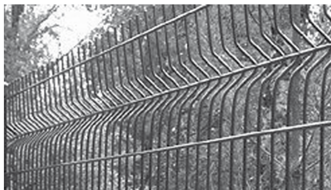
Clôture avec des panneaux Médium Zéphyr®

Le panneau Médium Zéphyr® se pose à l'avancement, en scellement au sol sur terrain plat ou dénivelé, ou dans un muret.