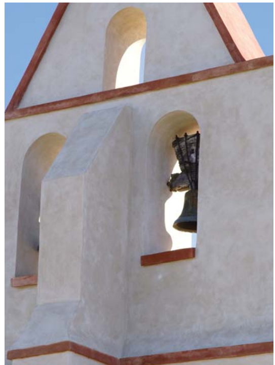
L'église du Lauragais - Chaux blanche et sable blanc