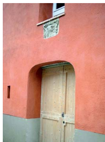
Façade en Rénochaux patinée (Aude)

La chaux blanche naturelle pure NHL 2 est particulièrement conseillée pour la restauration d'enduit et de rejointoiement sur supports tendres ou fragilisés, pour le bâti ancien ou pour les monuments historiques. Sa prise douce dans le temps préserve les matériaux fragiles et évite tout risque d'arrachement.