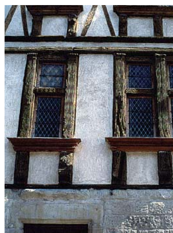
Façade en chaux blanche (Carcassonne)