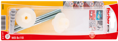
Fixation pour lavabos et urinoirs WD