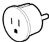
ADAPTATEUR ENTREE USA SORTIE FRANCE 2P+T BLANC