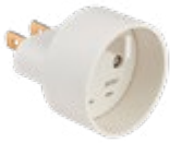
701080 ADAPTATEUR ENTREE FRANCE 2P 10/16A SORTIE USA