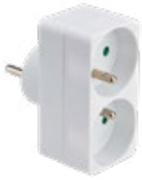
714770 BIPLITE FAÇADE 2P+T 10/16A