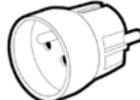
ADAPTATEUR ENTREE FRANCE SORTIE ALLEMAGNE 2P+T 10/16A BLANC