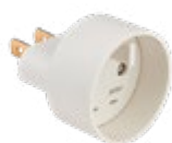
701080 ADAPTATEUR ENTREE FRANCE 2P 10/16A SORTIE USA