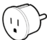
ADAPTATEUR ENTREE USA SORTIE FRANCE 2P+T BLANC