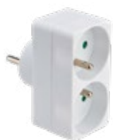
714770 BIPLITE FAÇADE 2P+T 10/16A