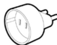
ADAPTATEUR ENTREE USA SORTIE FRANCE 2P 6A BLANC