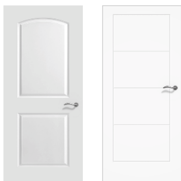
Postformée Postformée tendance