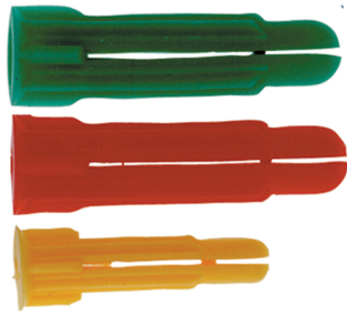
Fixation multi-usages PC