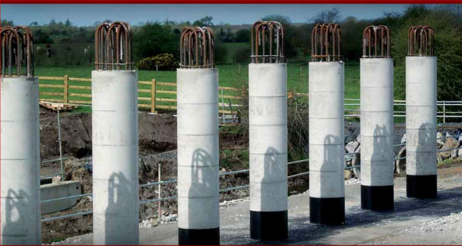
Le 1 ER coffrage pour piliers circulaires