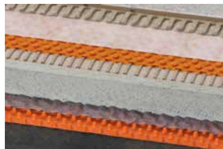
Schlüter-TROBA-PLUS 8 (12)

Pour les structures réalisées sur un lit de gravier ou de concassé d'épaisseur < 5 cm, un léger effet de ressort peut se produire. Afin d'éviter cet effet, nous recommandons de procéder à la pose sur Schlüter-TROBA, voir fiche technique produit 7.1.