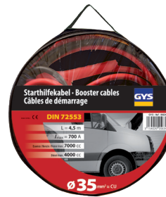
056343 700 A