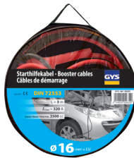
056329 320 A