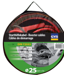
056336 500 A