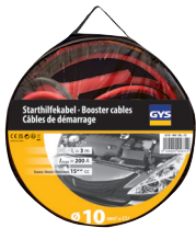
056312 200 A