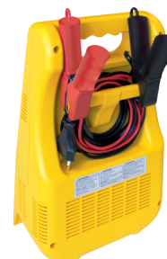
Logement pour rangement des câbles et pinces.