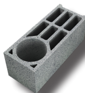
Bloc d'angle 3 lames d'air