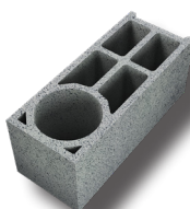
Bloc d'angle 2 lames d'air