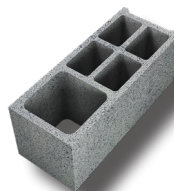
Bloc d'angle carré