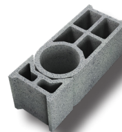
*Bloc multi angles