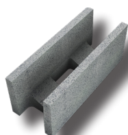
Bloc linteau chaînage