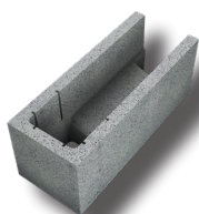
Bloc linteau angle