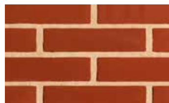
Terre carmin patinée