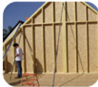
Réf. 5511 "Spécial pignons"