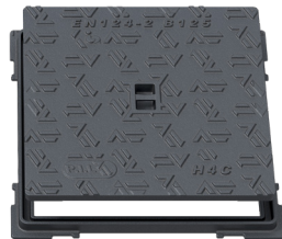
H6C, H7C, H8C, H9C, H10C B125