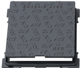
H3C, H4C, H5C B125

L'ouverture des versions H3C, H4C, H5C B125 est réalisée par basculement (encoche prévue à cet effet). L'ouverture des versions H6C à H10C B125 est réalisée par utilisation de 1 ou 2 points de préhension.