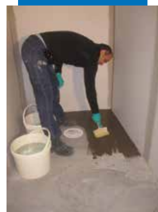
Appliquer la barbotine d'accrochage