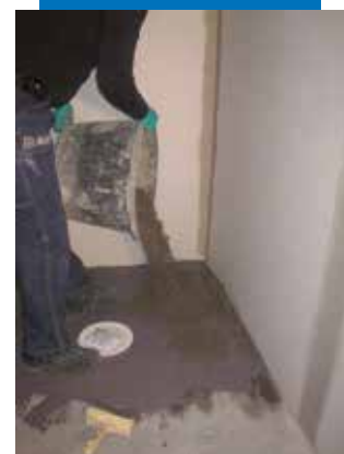
Réalisation de la forme de pente