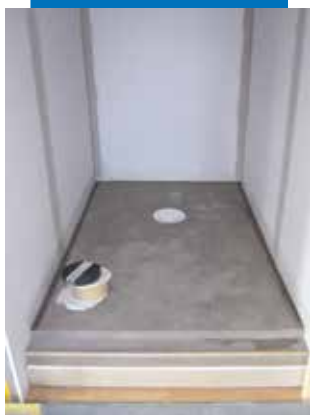
La forme de pente est terminée