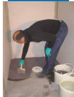
Humidifier le support

N.B : Les informations et prescriptions de ce document résultent de notre expérience. Les données techniques correspondent à des valeurs d'essais en laboratoire. Vérifier avant utilisation si le produit est bien adapté à l'emploi prévu dans le cadre des normes en vigueur. Ce produit est garanti conformément à ses spécifications, toute modification ultérieure ne saurait nous être opposée. Les indications données dans cette fiche technique ont une portée internationale. En conséquence, il y a lieu de vérifier avant chaque application que les travaux prévus rentrent dans le cadre des règles et des normes en vigueur, dans le pays concerné. Nous nous réservons le droit de modifier notre documentation technique. Il y a donc lieu de vérifier que le présent document correspond à notre dernière édition.