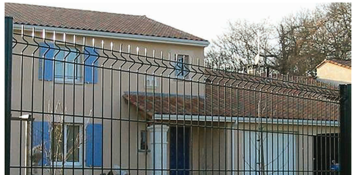
Panneau AQUILON® 45 Medium

La clôture AQUILON® 45 Medium s'installe avec des clips qui lui permettent de générer les redans avec précision en fonction du terrain à délimiter.