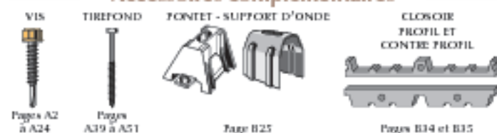
Page A2 à A24