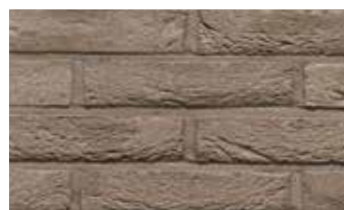
Pagus gris "Iluzo"