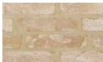
Oud Bologne "Héritage"