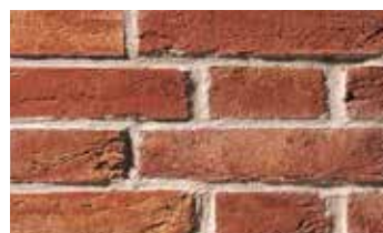
Pleine des Flandres /Vieille Ferme