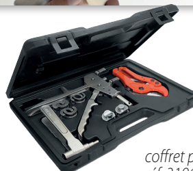
coffret pince à glissement réf. 3196-B1