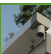
Toit équipé de gouttières latérales