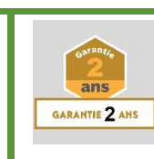
Polycarbonate garantie 2 ans