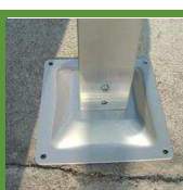
Socle de fixation au sol