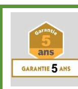
Structure garantie 5 ans