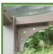
Toit forme 1/2 lune protecteur & très clair