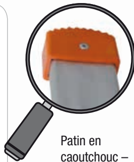
Patin en caoutchouc – hauteur 5 cm