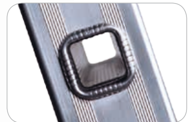
Echelon carré 30 x 30 mm

MISE A JOUR AVEC LA NOUVELLE NORME: 01/2018