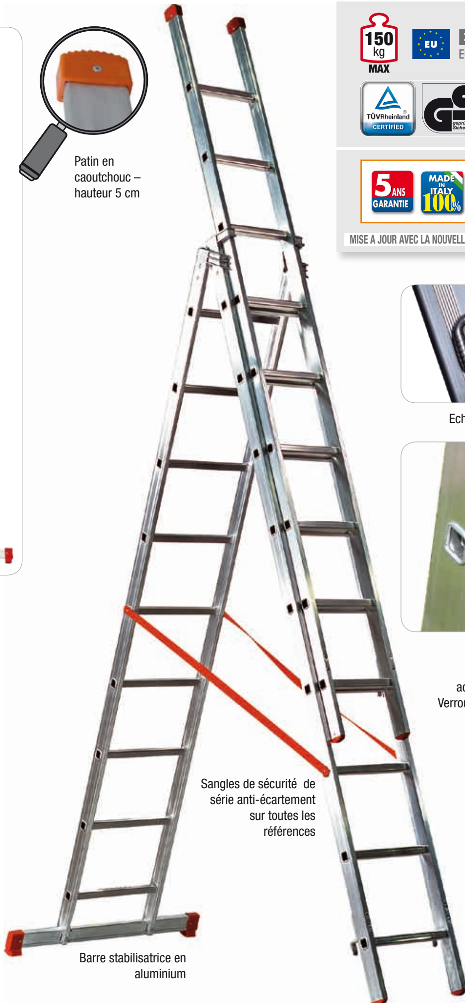
Barre stabilisatrice en aluminium