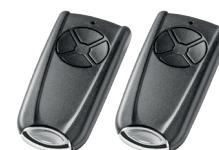
EuroPro 720 2 émetteurs RSC 4 BS