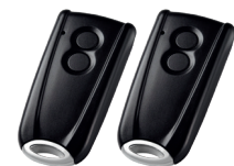
EuroPro 700 2 émetteurs RSC 2