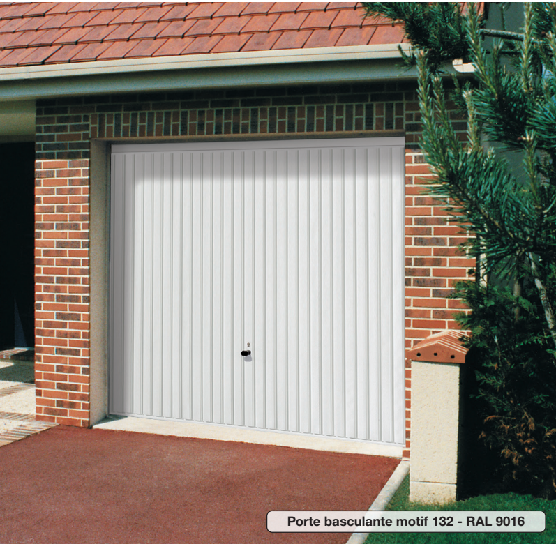
Porte basculante motif 132 - RAL 9016

Porte prémontée motorisable avec cadre dormant en acier galvanisé tubulaire sur 3 côtés, sans barre de seuil.