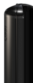
Profil du poteau EXPERT (260S)

RETROUVEZ TOUS LES COLORIS DISPONIBLES DANS LE CATALOGUE TECHNIQUE