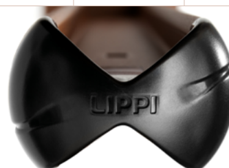
Bouchon du poteau EXPERT (260S)