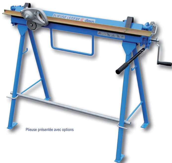
Plieuse présentée avec options