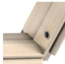
8 Gâche + pour réception du loqueteau