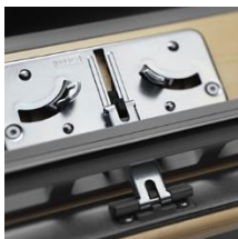
1 Boîtier de serrure + acier galvanisé + couleur argent