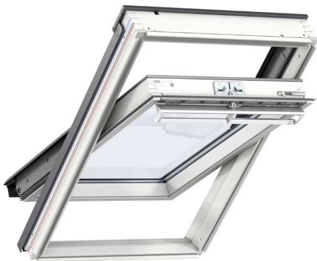
Fenêtre GGL finition WhiteFinish