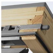
6 Loqueteau pour ouverture à 180° + blocage de la fenêtre en position nettoyage