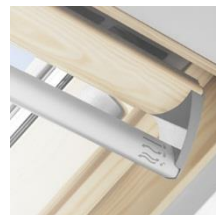
4 Barre de manœuvre + manipulation souple + clapet de ventilation + positions fermeture, aération, et ouverture