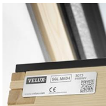
2 Plaque d'identité + type de fenêtre + taille et code produit + marquage CE + code de production + code QR