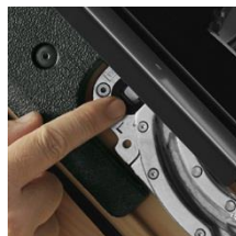
3 Enclenchement des profilés + pour insérer et maintenir les profilés extérieurs de couverture