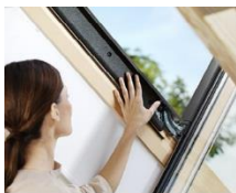
ThermoTechnology™ 5 Système isolant breveté + polystyrène expansé