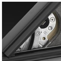
7 Pivot mobile + acier galvanisé + couleur argent