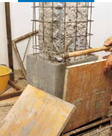
Décoffrage (coffrage en bois)