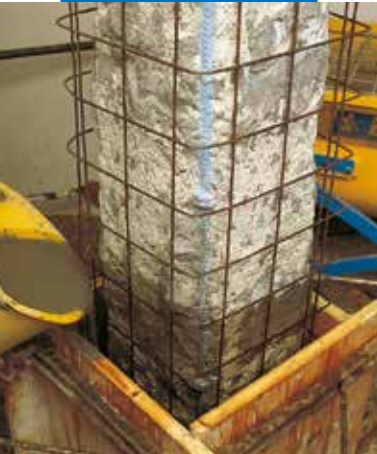
Coulage dans un coffrage