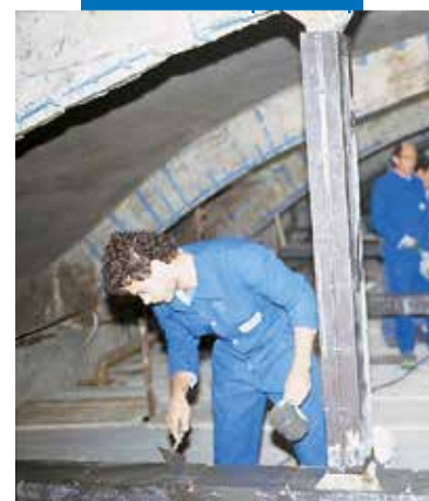
Coulage de Mapegrout Colabile dans un coffrage métallique