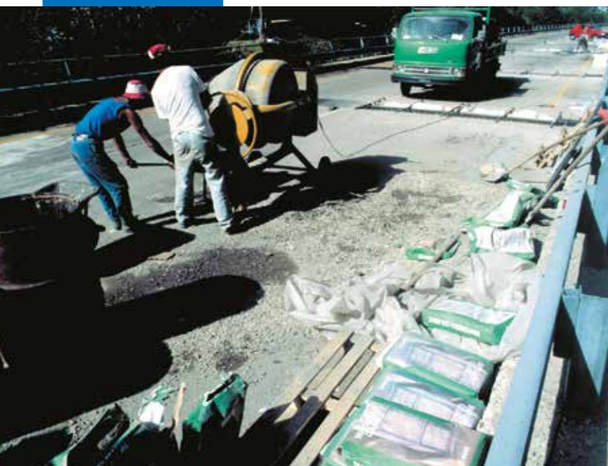
Rénovation de joints routiers

MAPEI DEGAGE TOUTE RESPONSABILITÉ EN CAS DE MODIFICATION DU TEXTE OU DES CONDITIONS D'UTILISATION CONTENUES DANS CETTE FT OU SES DÉRIVÉS.