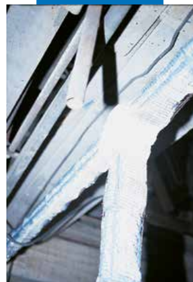
Structure en béton dégradée