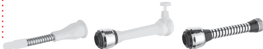
Brise-jet à visser F22x100