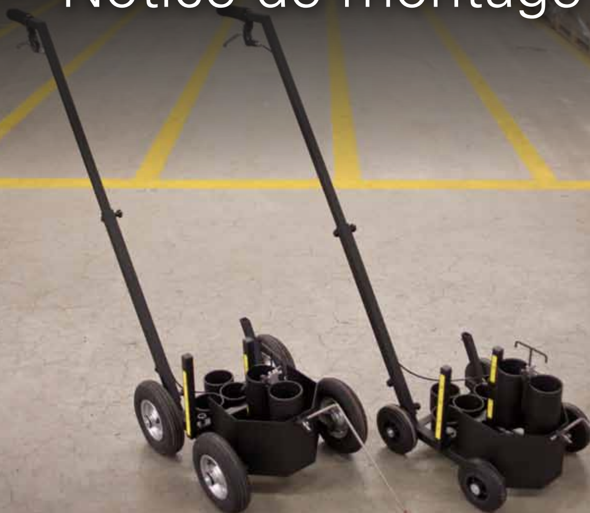
Speedliner 2 Air Ord.No.: 290459