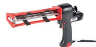
Pistolet à batterie FIS DCD S