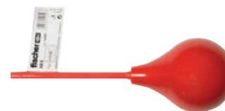
Soufflette AB K