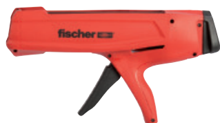
Pistolet FIS DM S