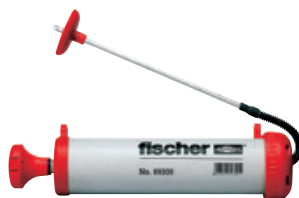
Soufflette AB G