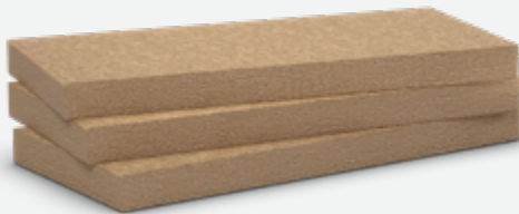
Rockcomble nu : panneau de laine de roche non revêtu.