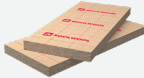
Rockcomble kraft : panneau de laine de roche revêtu d'un kraft polyéthylène.