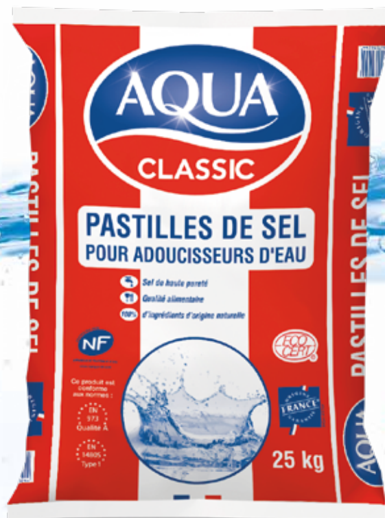
Conditionné en sac de 15 & 25 kg

AQUA CLASSIC® est adapté aux usages domestiques et professionnels.