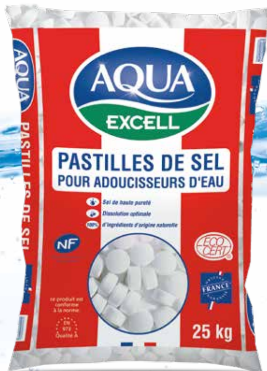
Conditionné en sac de 10, 15 et 25 Kg

AQUA EXCELL® est certifié marque NF, nos pastilles font ainsi l'objet d'un suivi qualité rigoureux. Elles répondent par ailleurs aux exigences des normes européennes EN 973 Qualité A et EN 14805 Type 1.