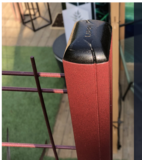
Profil du poteau habitat avec bouchon.

Pour les installations sur platine à visser, prévoir 1 sachet de visserie Lippi pour 5 platines.