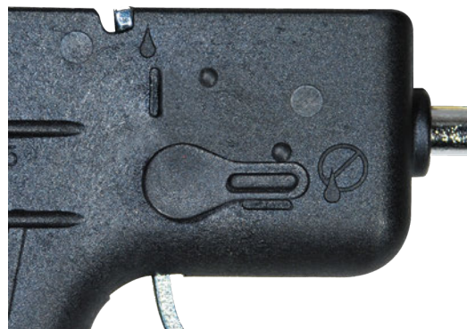
2 débits possibles