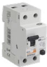
707817 INTERRUPTEUR DIFFÉRENTIEL 2P 30MA 40A TYPE A