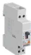
707558 CONTACTEUR JOUR/NUIT 20A 230V