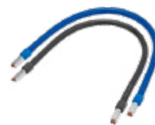
Tableaux Électriques & Disjoncteurs CABLE DE CONNEXION AVEC EMBOUT SERTI H07VK 10MM 2 0,3M