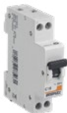
707503 DISJONCTEUR 3KA PHASE+NEUTRE 16A