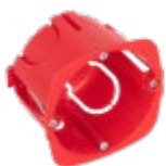
718021 BOITE D'ENCASTREMENT CLOISON SECHE 1 POSTE Ø67/P50