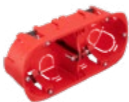
718762 BOITE D'ENCASTREMENT CLOISON SECHE 2 POSTES DOUBLE SENS Ø67/P40