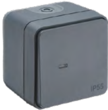
730424 VA ET VIENT LUMINEUX / TÉMOIN ANTHRACITE