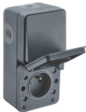
730429 DUO VA ET VIENT PRISE 2P+T ANTHRACITE