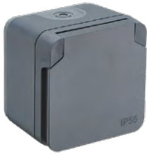
730420 PRISE 2P+T ANTHRACITE