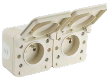
730453 DOUBLE PRISE 2P+T SABLE