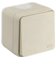
730450 VA ET VIENT SABLE