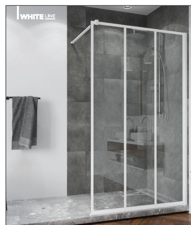
↑ Finition Blanc Mat