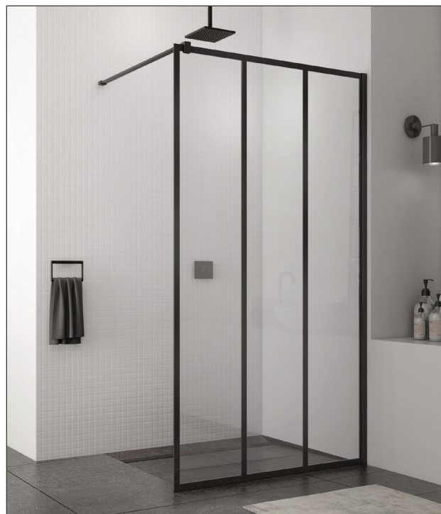
↑ WALK-IN EASY paroi fixe avec profilé mural de compensation STR4P (Noir mat), vitrage Loft 72