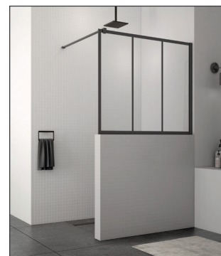
↑ Concept EASY Loft 72 : STR4P + SM1 (Noir mat)