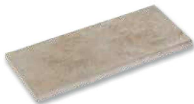
Margelle Droite NF 80 x 33 cm ép. 3,5 cm 25 u/palette - 20 ml