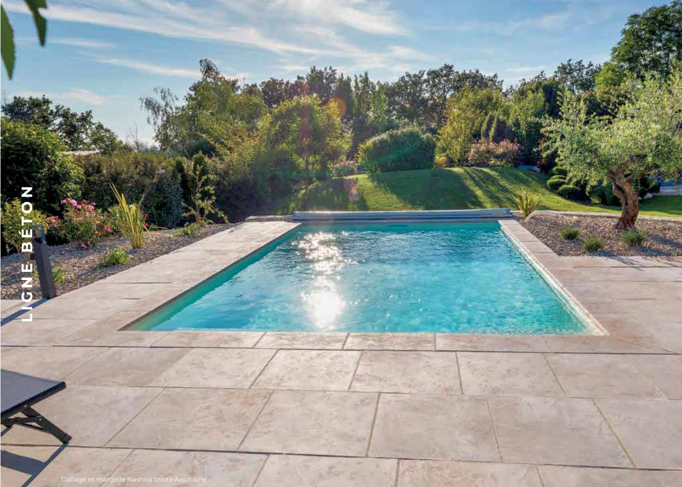
Dallage et margelle Nashira teinte Aquitaine