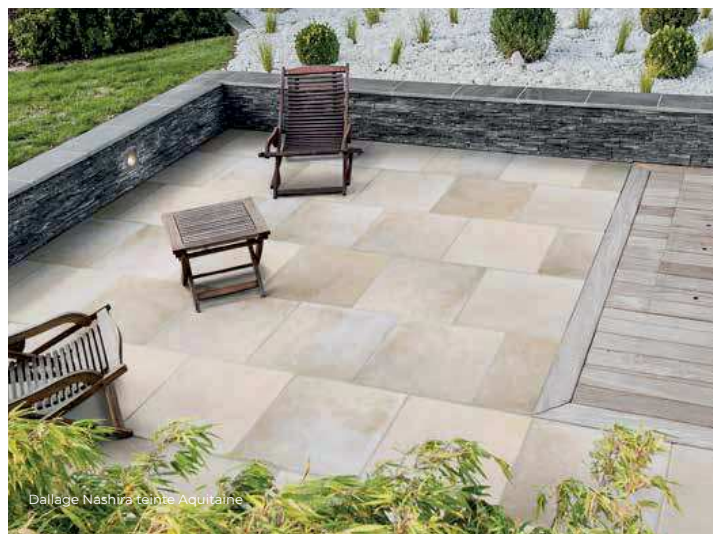
Dallage Nashira teinte Aquitaine