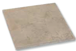
Dalle 60 x 60 cm ép. 3 cm 30 u/palette - 10,80 m 2