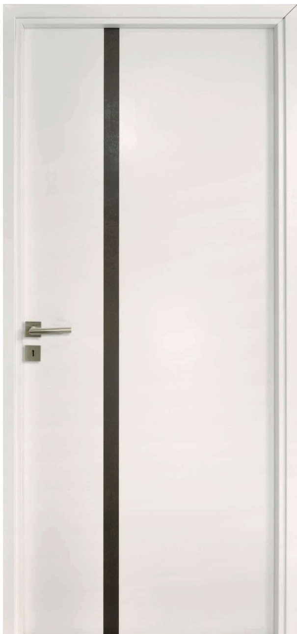
Medium laqué blanc satiné avec bandeau en céramique