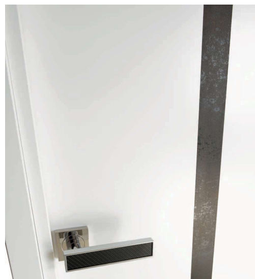
Zoom Zao signature céramique avec poignée Carbonis