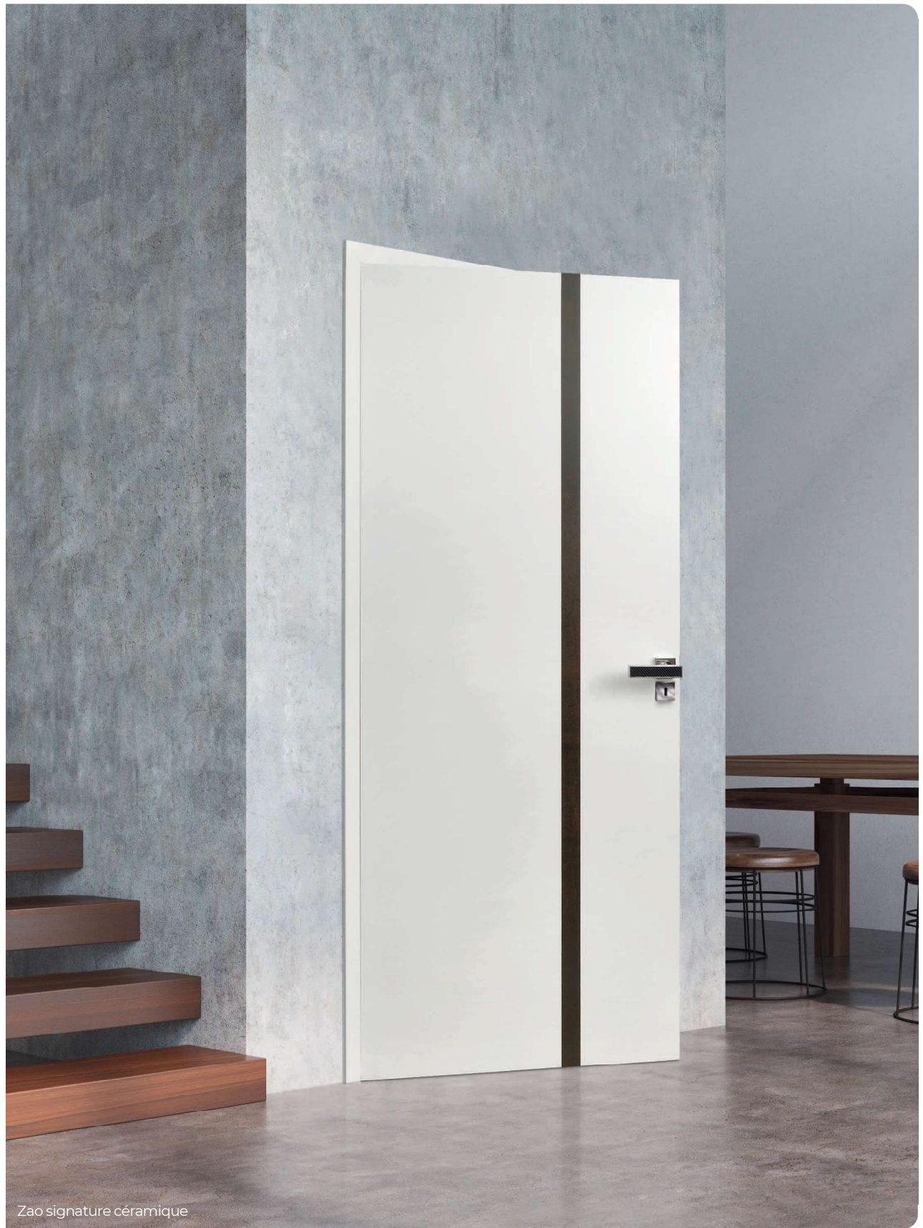
Zao signature céramique